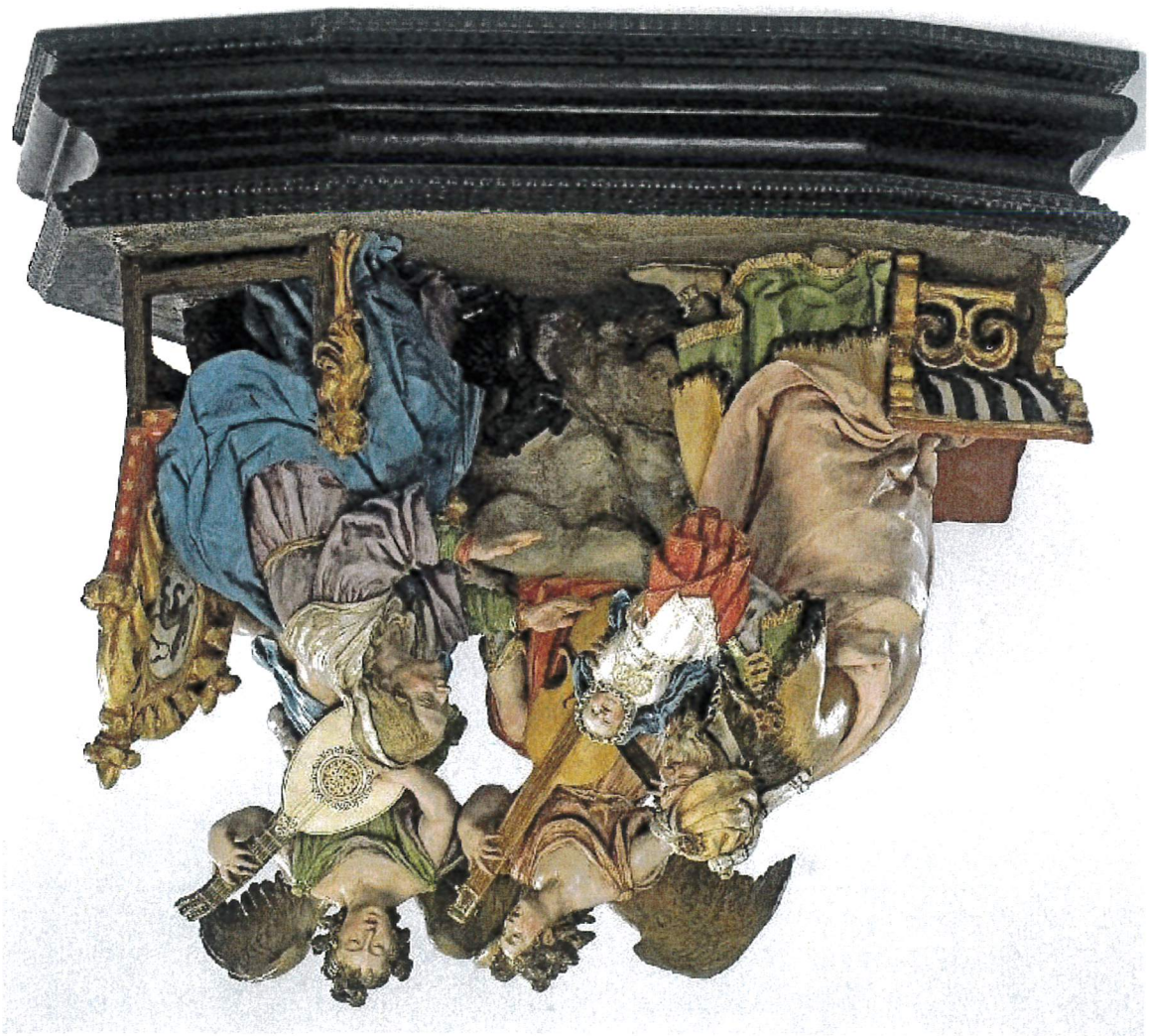
BLOQUE V. 2