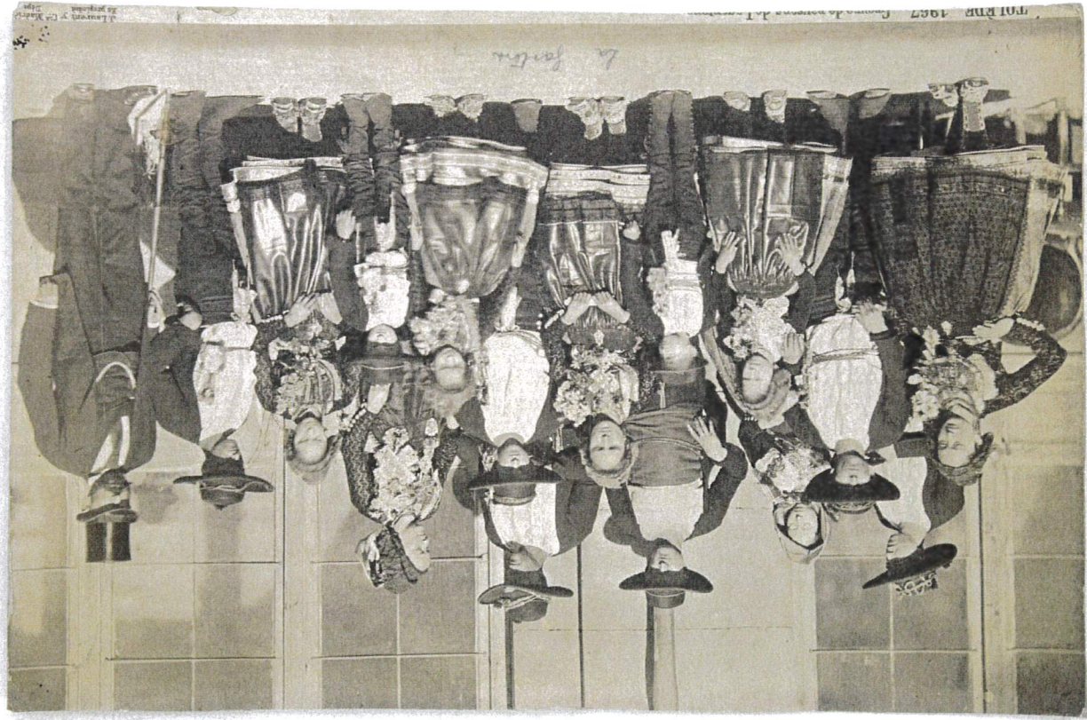
BLOQUE IV. 1