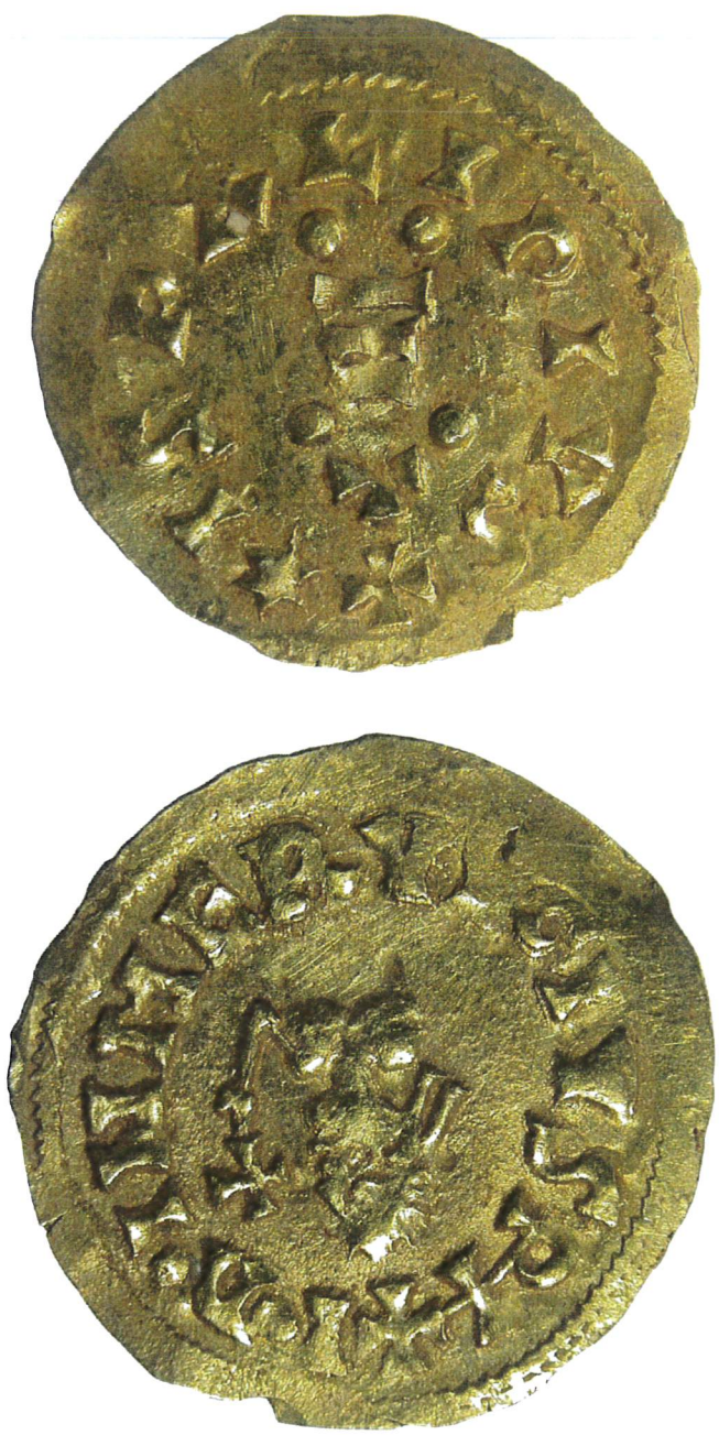
BLOQUE III. 1